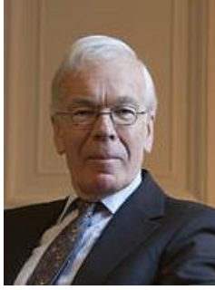
mr. H.D. Tjeenk Willink, Minister van Staat