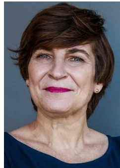
drs. Lilianne Ploumen senior adviseur Clara Wichmann Stichting voormalig minister en Kamerlid