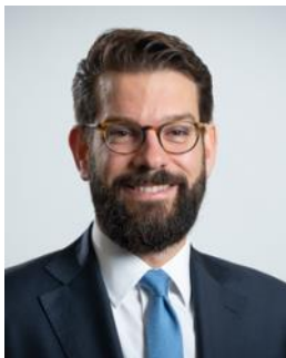
prof. dr. Caspar van den Berg bijzonder hoogleraar Transitie in de publieke sector Universiteit Leiden en senator