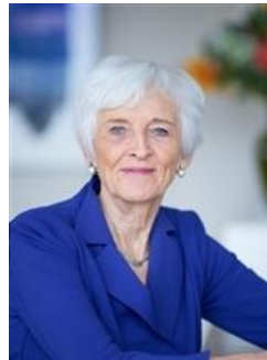
prof. dr. J. Cramer hoogleraar sustainable innovation, strategisch adviseur USI en voormalig minister